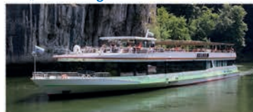
Schiffsneubau MS „Kelheim“